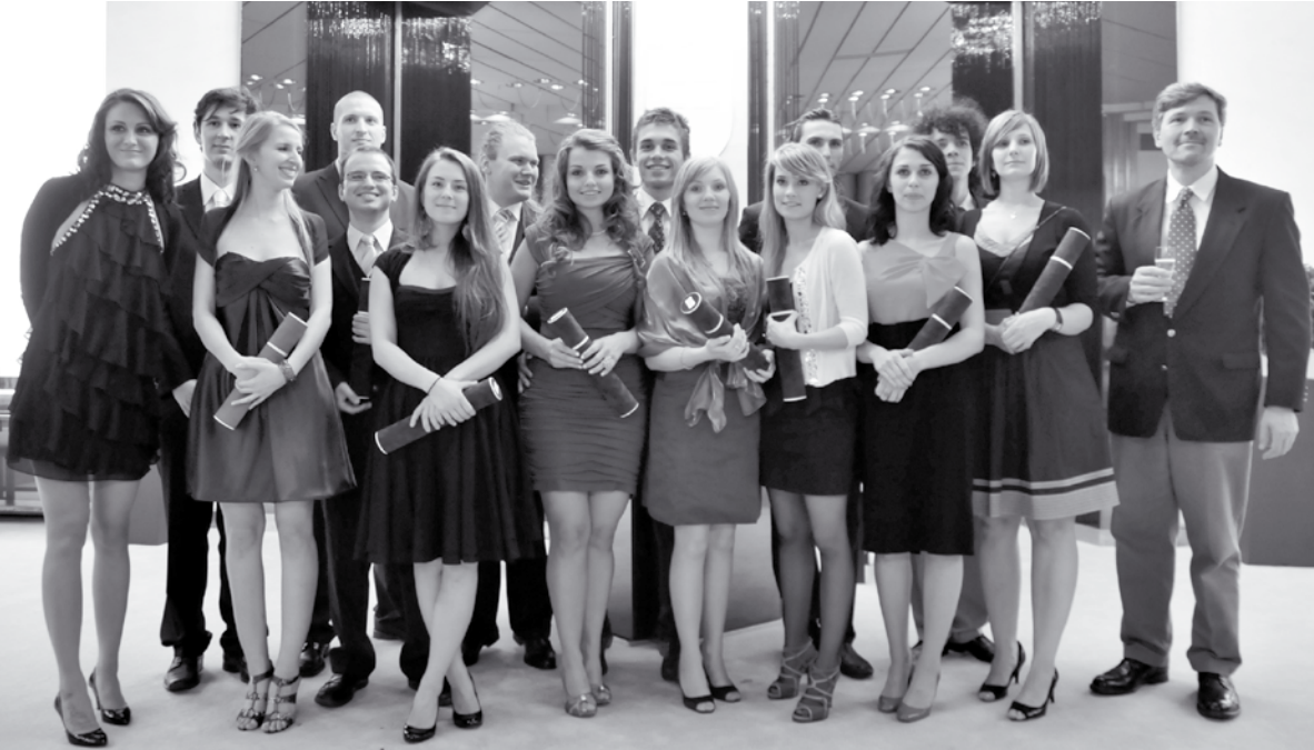
Promócie/Graduation, 24. júna 2010