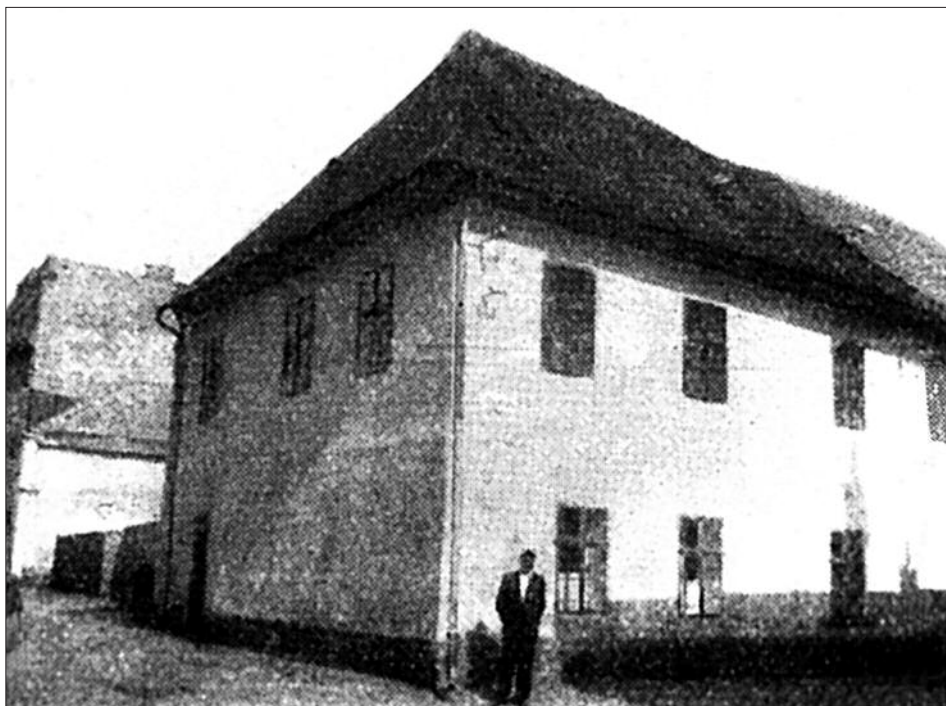
Prostějov – rodný dom E. Husserla / A house Husserl was born