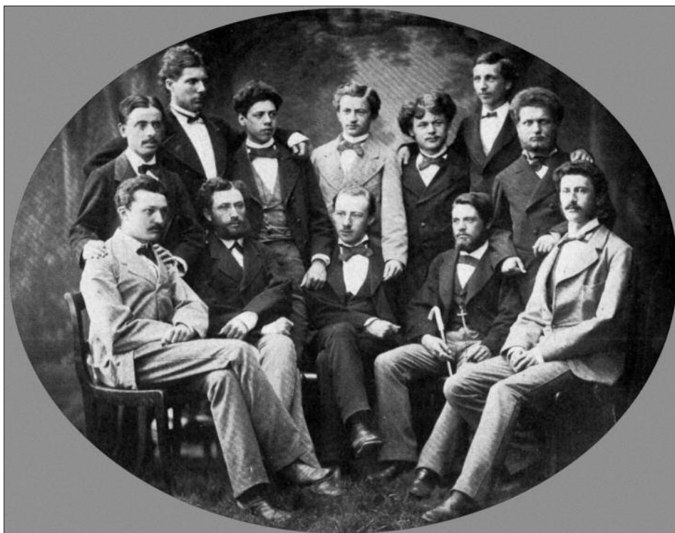
Edmund Husserl so spolužiaci (prvý stojaci sprava) / E. Husserl with schoolmates (first from right, standing)

změnil „nadproporcionální“ počet Židů na univerzitách a ve vědeckých ústavech ve prospěch „árijců“. Smutným faktem zůstává, že jeden z nejnadanějších Husserlových žáků, Martin Heidegger, který propadl svůdnému klamu nacismu, musel v roce 1933 jako no-vopečený rektor freiburské univerzity toto nařízení uvádět do praxe.