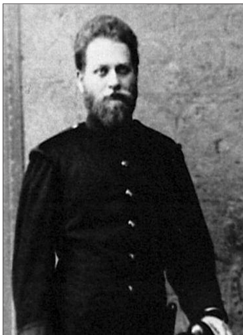
Edmund Husserl ako jednoročný dobrovoľník v Olomouci / Husserl as an army volunteer in Olmütz

ghettu by všechno prozradily. Tak se například už zmíněný Wolfgang podíval poprvé do rodiště svého otce až v roce 1914, když už byl plnoletý, bohužel asi v poslední možné chvíli, neboť zakrátko narukoval na frontu první světové války a padl u Verdunu.