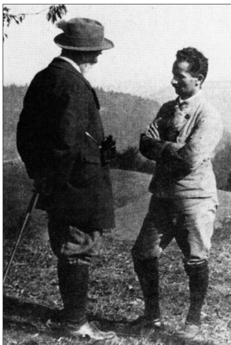
Edmund Husserl a Martin Heidegger, 1921

s Bohem, který mě zřejmě k této samotě povolal“ (Husserl BW/3, 433-434).