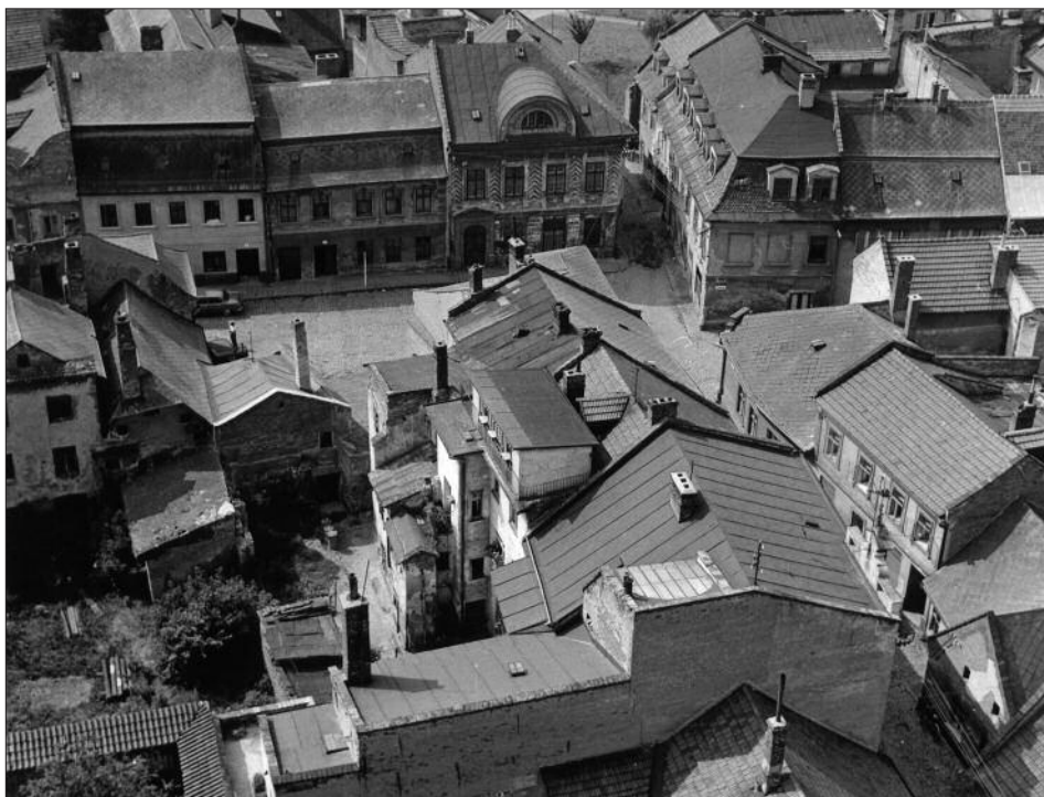
Pohľad na už neexistujúcu židovsku štvrť / A no longer existing Jewish quarter in Prostějov