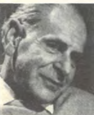
KARL R. POPPER

Ludwig Wittgenstein: Tractatus logico-philosophicus (Logisch Philosophische Abhandlung / Antológia z diel filozofov, 1969, v češtine 1993)