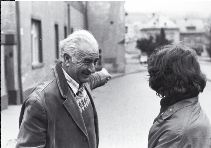
Potulky starou Bratislavou